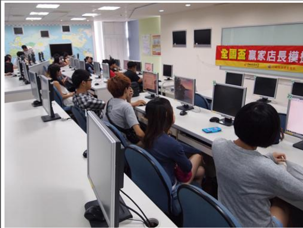
環球科大參賽隊伍一景 |。