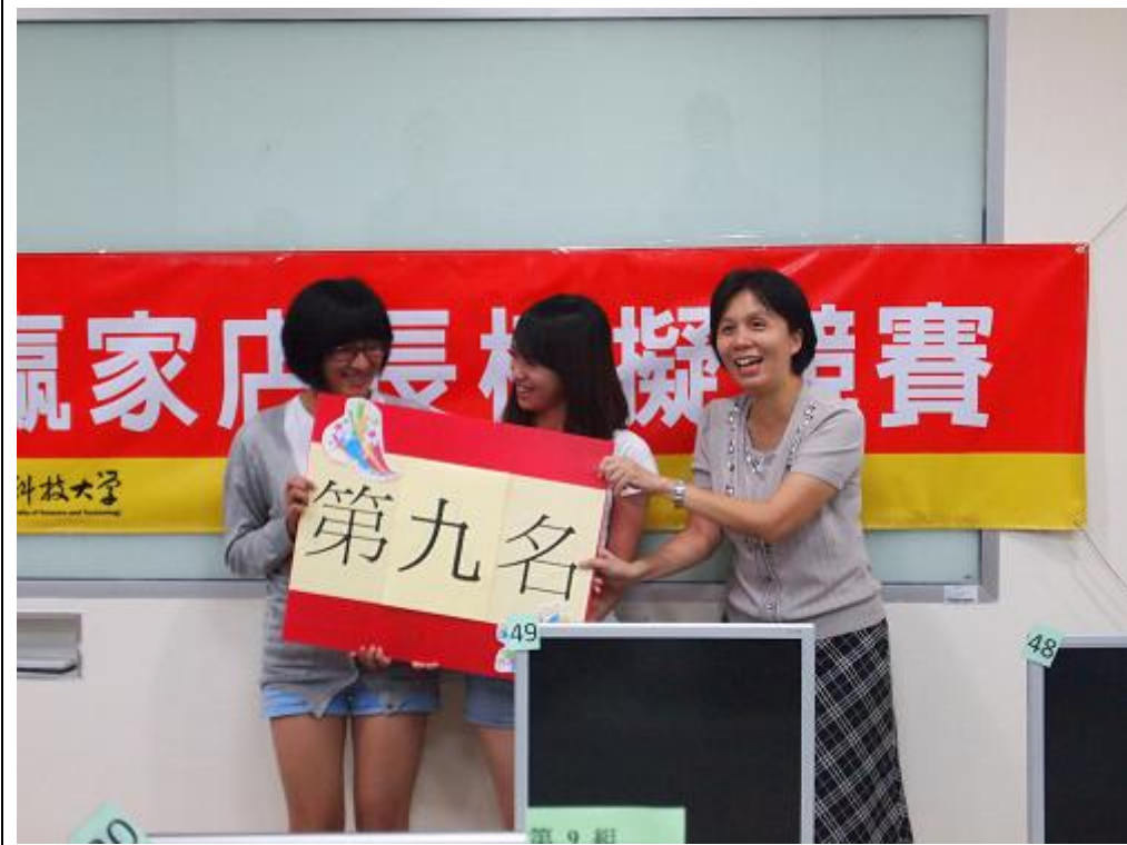
「思思」隊，獲得 第9名。恭喜。