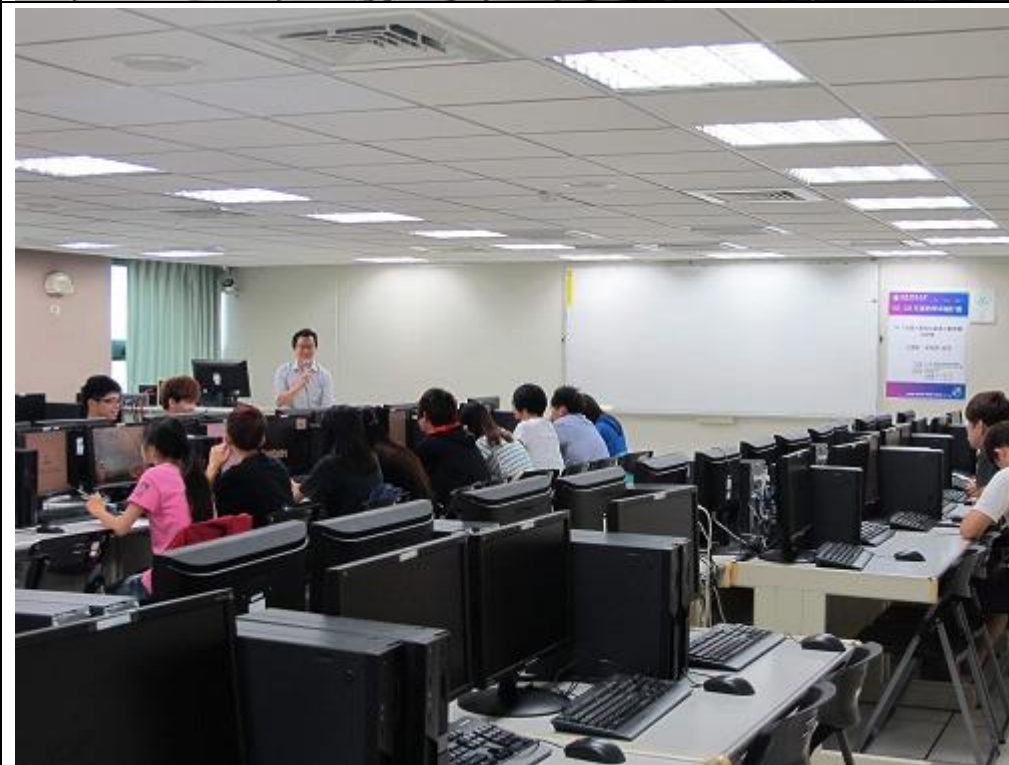
遠眺整個上課場景。