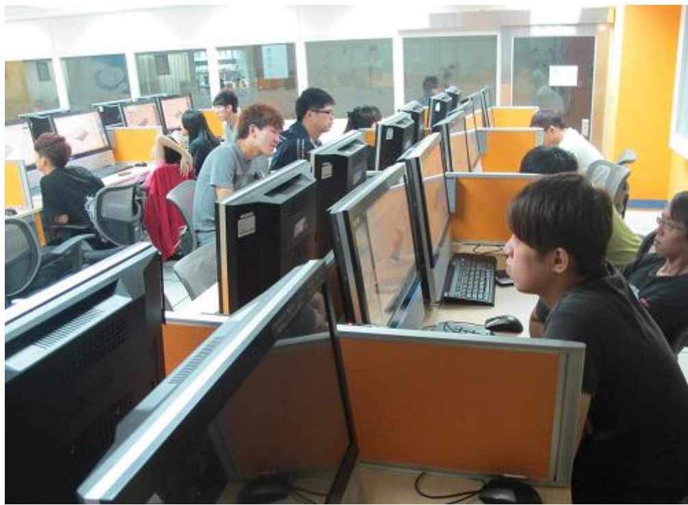
學員們正在自行練習 VBR 軟體。全神貫注。