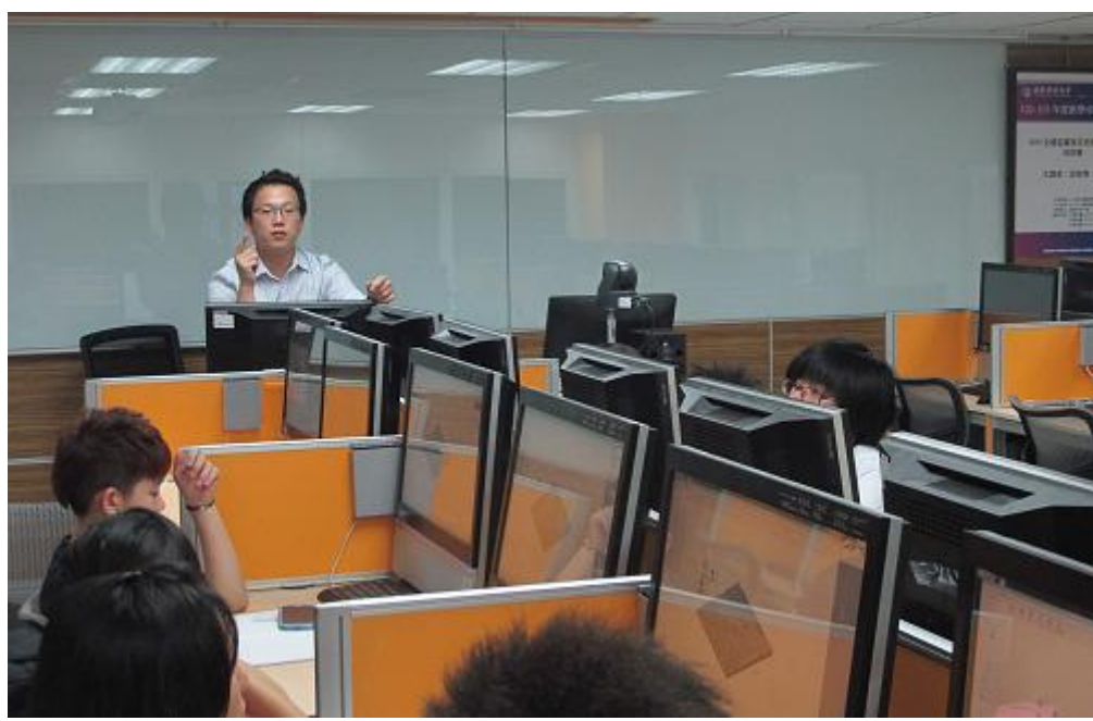
學員們正在自行練習 VBR 軟體。