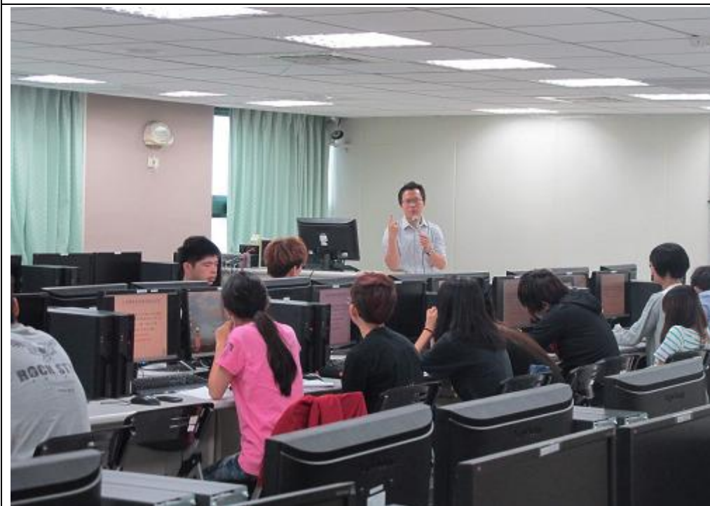
在同學背後拍攝專 心上課的情形。大 家辛苦了。