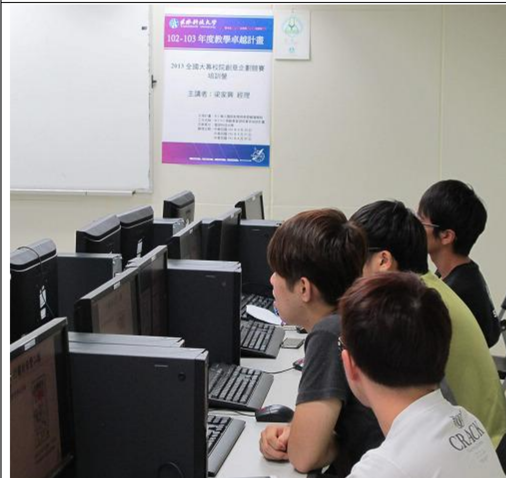
大四的學長也全程參與，值得讚許