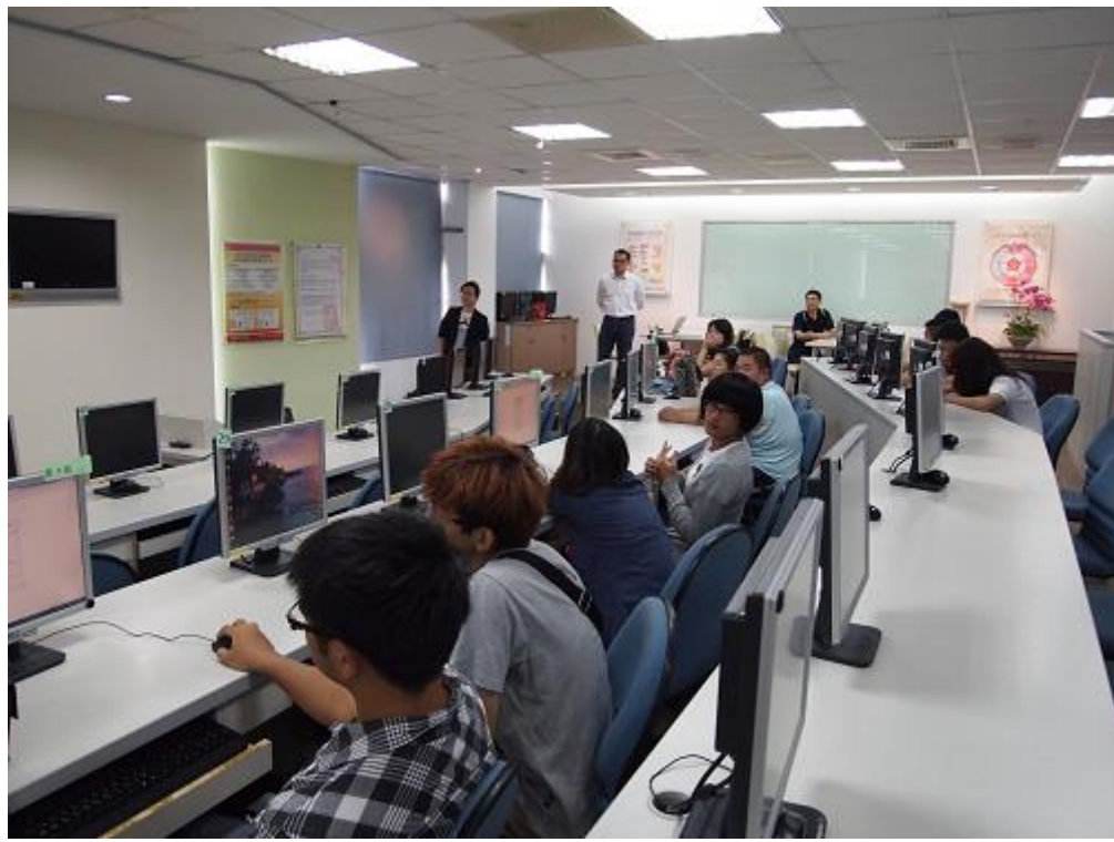
環球科大參賽隊伍 一景 II。