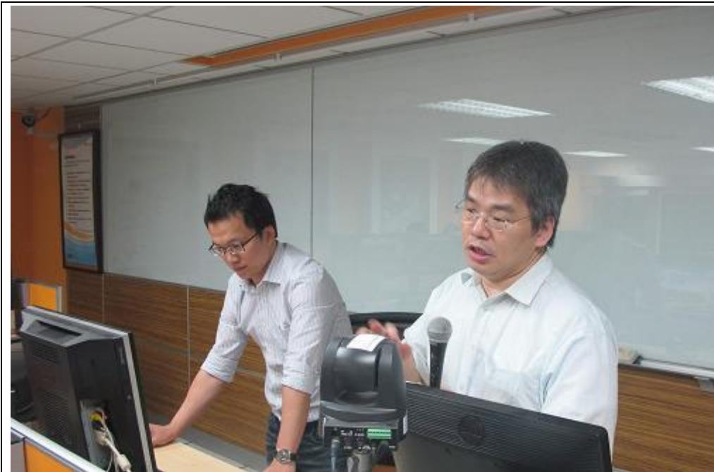
「2013 全國盃贏家店長模擬競賽培訓營」第 2 次課程開始。