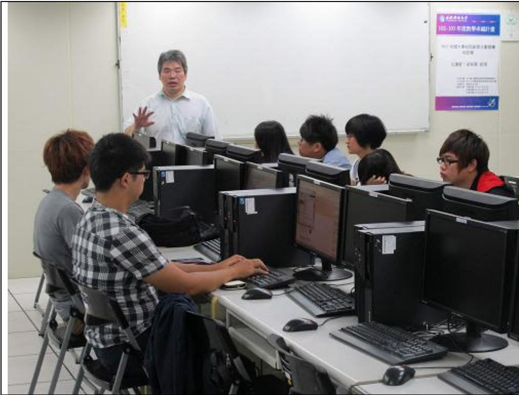
「2013 全國大專校院創意企劃競賽培訓營」第 2 次課程，開訓。