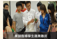
業師指導學生蔬果雕刻