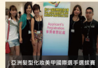
亞洲髮型化妝美甲國際選手選拔賽