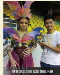
世界潮流髮型化妝競技大賽