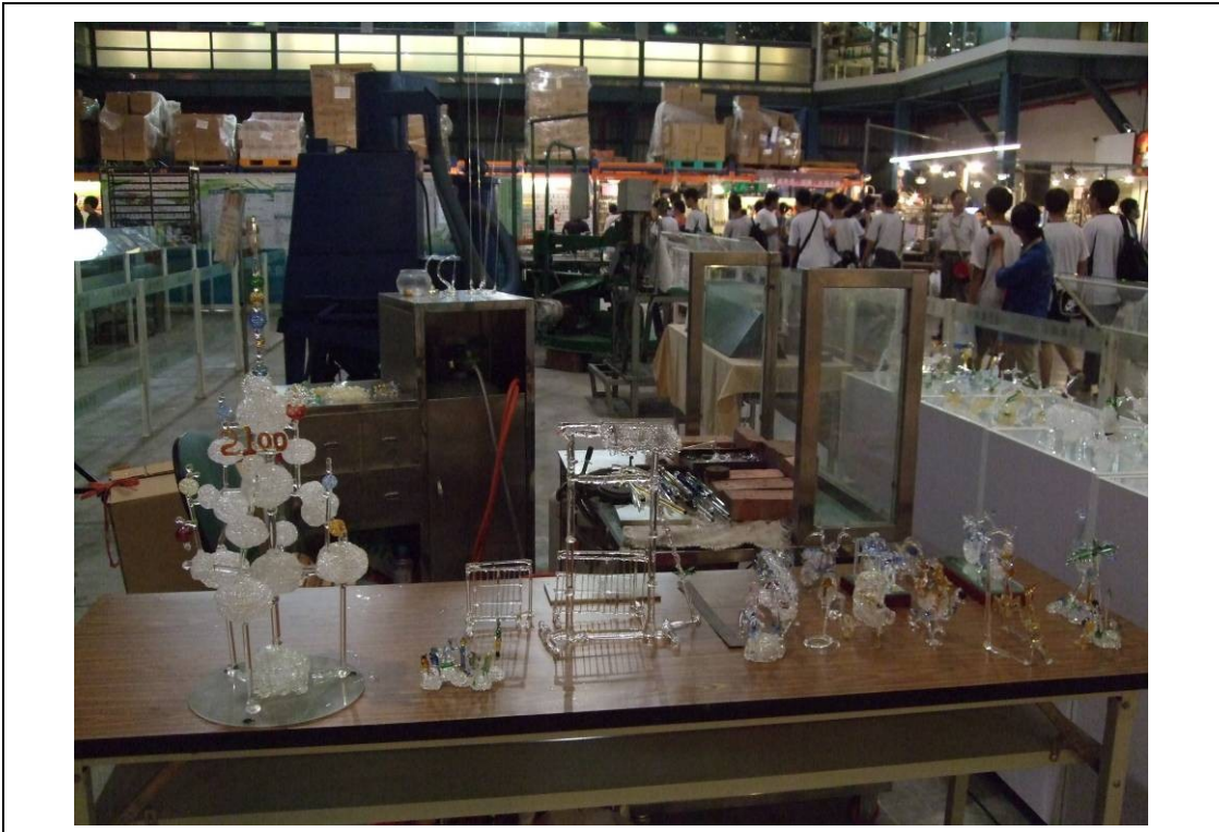
照片說明：台灣玻璃職場體驗