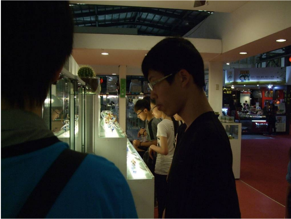
照片說明：台灣玻璃職場體驗