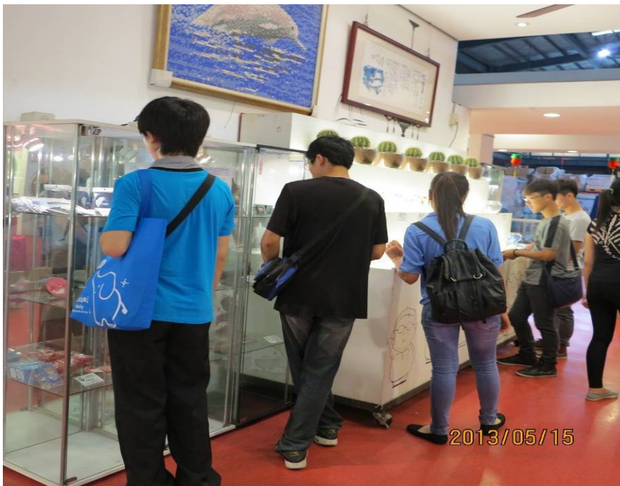
照片說明：台灣玻璃職場體驗