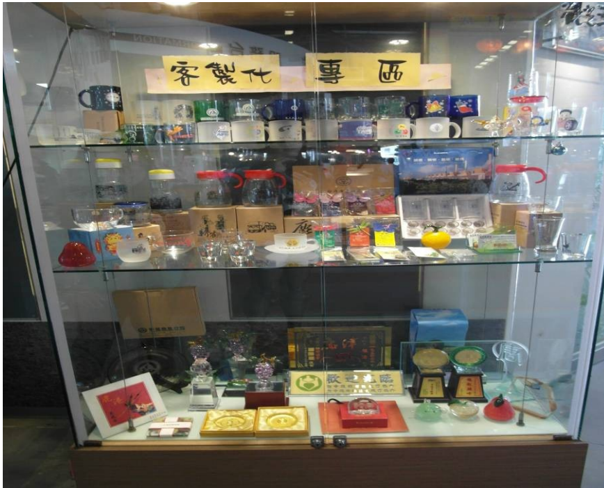
照片說明：產品展示