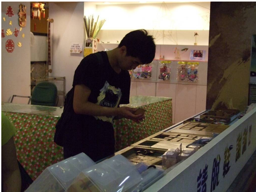
照片說明：台灣玻璃職場體驗