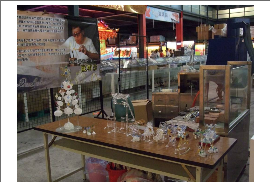
照片說明：台灣玻璃職場體驗