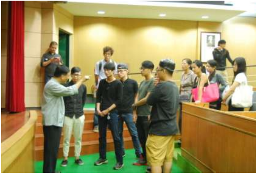
與黃老師進行討論並指導

備註 照片除了插入 word 檔中，亦請附上原始照片清晰圖檔附件以利上傳至卓越計畫專區中。