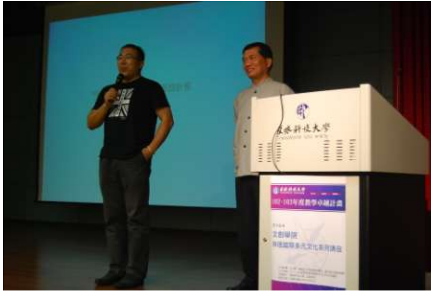
由創意商品設計系主任開場介紹