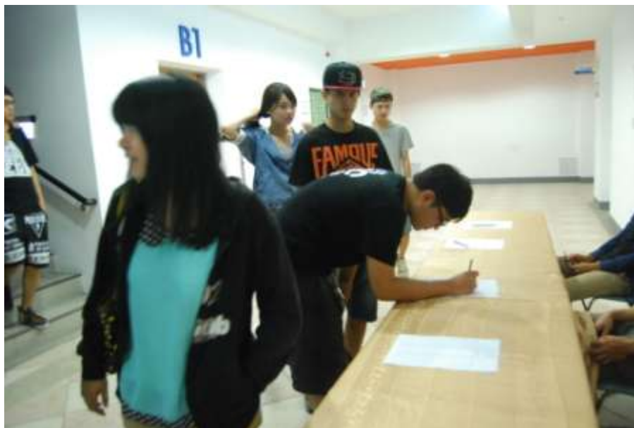
同學於講座開始前進行簽到情形