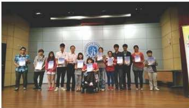
各系評比第1、2名班級頒獎